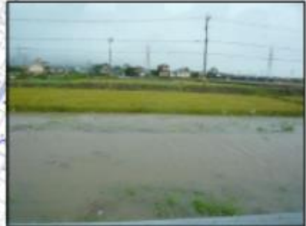
平成16年9月21日 15号台風